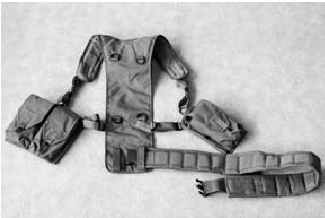
Pilt 2.2 Traksid

1. Rakmete rihm pange läbi traksid alumise parem-poolse aasa.